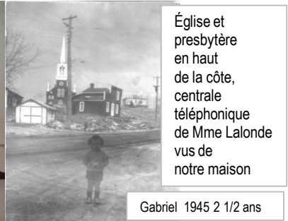
Église et presbytère en haut de la côte, centrale téléphonique de Mme Lalonde vus de notre maison